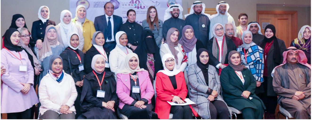
الحضور خلال المؤتمر

الجمعية الكويتية التطوعية النسائية لخدمة وتنمية المجتمع