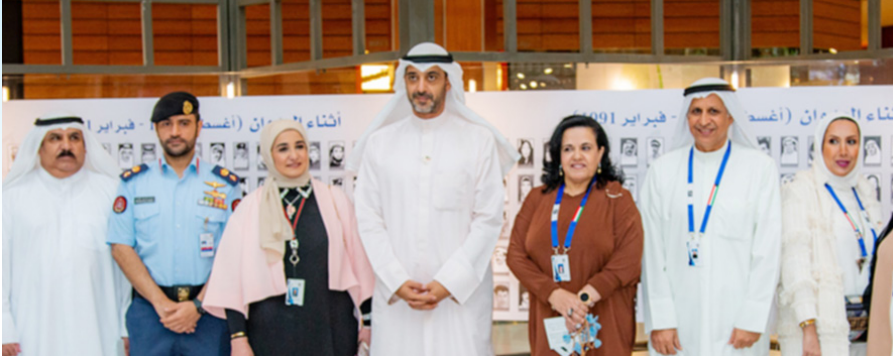
تكريات لأسر الشهداء

تصريح بمناسبة ذكرى الغزو العراقي الغاشم أن تصدي الشعب الكويتي للعدوان شكل مرحلة فريدة في مسيرة هذا الوطن وكفاح أبنائه، إلا أن التاريخ يخبرنا بأن ذلك الحدث لم يكن إلا صفحة من صفحات مشرقة لهذا الشعب، وأنه يزخر بأمثلة رائعة تكشف عن عمق القيم في وجدان وتفكير المواطن الكويتي، وان ما بناه الكويتيون للأسوار الثلاثة لبلدهم لم يكن إلا دليلاً على استعدادهم للدفاع عن سلامة وطنهم ووحدة أرضهم في كل مرحلة من مراحل التاريخ.